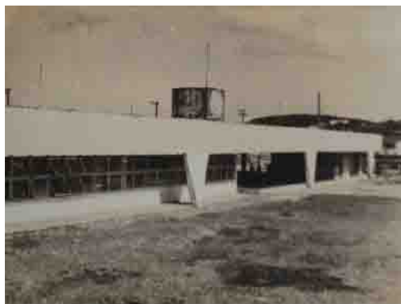
Fig. 06: Abrahão Sanovicz, Ginásio Estadual em Santos- Ponta da Praia, Santos. Fonte: ALVES (2008, p. 323)

Os ginásios de Artigas buscam igualmente uma ruptura em relação à arquitetura escolar tradicional ainda então vigente, desdobrando-se, inclusive, no uso da estrutura em concreto protendido do Ginásio em Eldorado Paulista (Proc. IP26616 de 04/12/1958), de Pedro Paulo de Mello Saraiva.