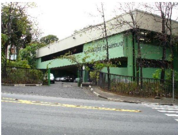
Fig. 09: Vilanova Artigas, Ginásio Estadual de Utinga, Santo André: fachada.

Para o Ginásio Estadual Conselheiro Crispiniano, em Guarulhos (Proc. IP 32277 de 17/09/1959), Alves (2008) comenta que o projeto foi desenvolvido em três níveis, com diferença de meio pé-direito entre si: as dependências da escola no nível mais alto; galpão no nível intermediário, vestiários, cantina e pátio no nível mais baixo. A exploração do desenho dos pilares, já presente no projeto de Itanhaém, se dá em Guarulhos com maior intensidade, em uma pesquisa formal que aproxima-se de Niemeyer e, de forma mais ampla, da arquitetura moderna brasileira, tal como acabou por tornar-se caracterizada pela historiografia elaborada até a década de 1970 e conhecida, inclusive internacionalmente.