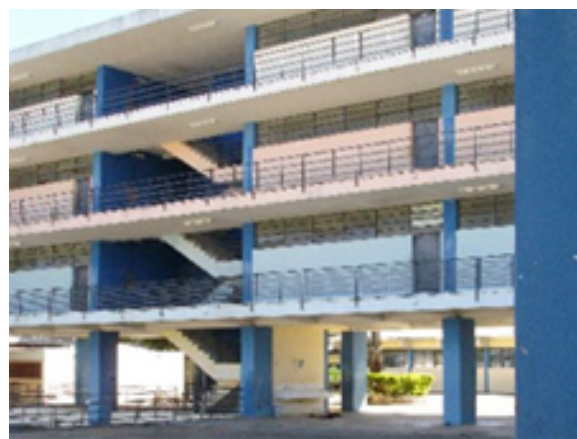
Fig. 08: Salvador Cândia, Marília: prédio das salas de aula.

O Instituto de Educação Monsenhor Bicudo, em Marília (Proc. IP 78816 de 26/12/1960), projetado por Salvador Cândia, também contém um extenso programa, que inclui uma escola Tipo III anexa – escola de aplicação. Da mesma forma que no Colégio e Escola Normal de Pompéia, o arquiteto eleva o bloco principal sobre pilotis , conectando-o a um volume térreo disposto ortogonalmente, que abriga as dependências administrativas linearmente ao longo de uma circulação, prevendo-se a iluminação e ventilação através de esquadrias de esquadrias que vão do chão ao teto e elementos vazados de concreto – ao invés dos tradicionais elementos cerâmicos. Utilizando madeira para sua estruturação, a cobertura é ocultada por platibandas que, no caso do bloco maior, deixam antever a cumeeira nas suas extremidades.