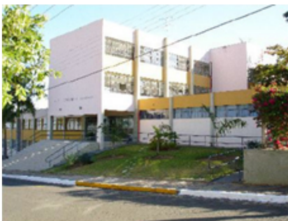
Fig. 07: Plínio Croce e Roberto Aflalo, Colégio Pompéia: vista geral.

A arquitetura das escolas praticada pelos arquitetos desse grupo pode ser compreendida a partir de seus edifícios de grande porte. Em contraste com espaços e técnicas construtivas tradicionais prescritas pelos arquitetos em alguns grupos escolares, o Colégio Estadual e Escola Normal de Pompéia - “Cultura e Liberdade” (Proc. IP 02206 de 23/01/1959) enfatiza soluções tipicamente modernas, como a clara configuração em volumes prismáticos ortogonalmente dispostos de modo a explorar o desnível do terreno, as amplas esquadrias que se repetem intercaladas pela estrutura rigidamente modulada em concreto armado, inclusive com a escadaria principal dando acesso a pavimento intermediário em pilotis , solução que se encontra também no pátio da escola primária de aplicação– cuja conexão com a escola normal revela-se extremamente funcional.