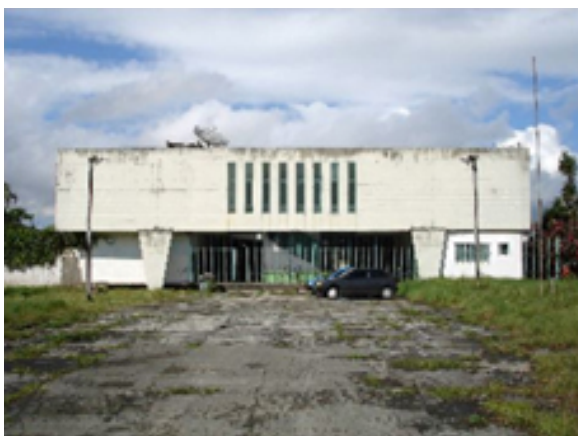
Fig. 05: Maurício Tuck Schneider, Grupo Escolar de Vila Pae Cará, Vicente de Carvalho, Guarujá: fachada. Fonte: ALVES (2008, p. 299)