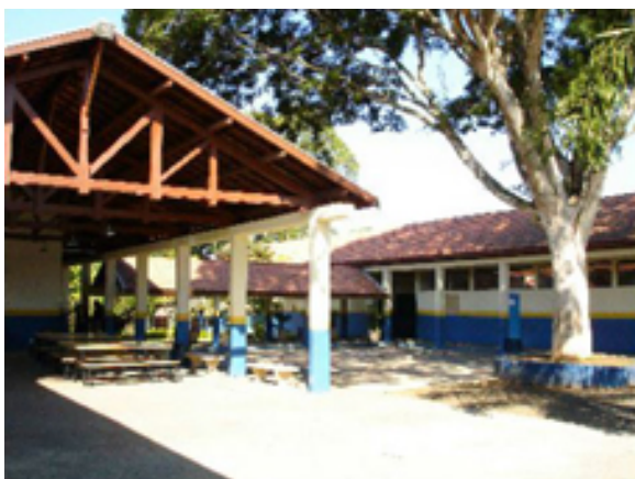
Fig. 01: Carlos B. Millan e Galiano Ciampaglia, Grupo Escolar de Guedes, Jaguaríuna: galpão e pavilhão desalas de aula. Fonte: ALVES, 2008, p. 202