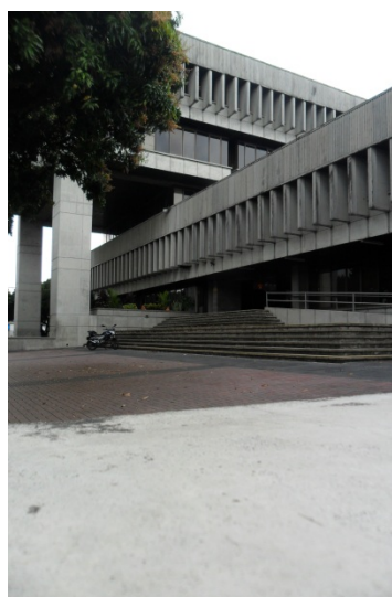
4. Gobernación de Risaralda en Pereira, Nótese el remate “peinilla”.

En la ciudad de Pereira se encuentra también una obra que data del año 1979 donde la influencia de la “peinilla” brutalista estadounidense es definitiva, un cliché 7 . Este ejemplo es significativo ya que el edificio de forma envolvente además de ser emblemático desde su uso se implanta inteligentemente en un sector necesitado de un buen espacio público, en frente el parque principal de Pereira. Este diseño remite al edificio de la Facultad de Arquitectura de la Universidad Nacional gracias al lenguaje formal con los parteluces que rematan el último nivel y los grandes pórticos que cobijan los paseos peatonales, la condición abierta y monumental de la estructura y una capacidad tremenda de atracción al usuario que abrazan la ciudad.