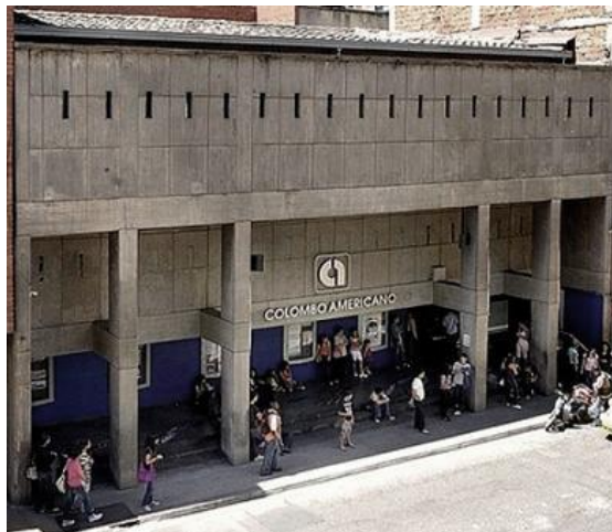
2. Centro Colombo Americano, edificio construido en el año 1968.