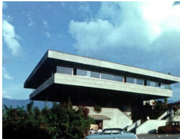
5. Restaurante – Mirado Cerro Nutibara, única edificación del parque.

En 1971 la Alcaldía de Medellín solicitó a Laureano proponer un “pequeño” edificio mirador en uno de los cerros tutelares de la ciudad, el Cerro Nutibara,. Fue así como se planteó una imponente estructura- mirador que dominara visualmente la ciudad, siendo un volumen bajo que ocultara al tiempo un conjunto de tanques de abastecimiento municipal descalificados por la población. Este camuflaje sugerido por la administración para generar un uso y un flujo constante de personas en un importante pulmón verde de la ciudad que estaba desaprovechado, encajó perfectamente en la tónica urbana de entonces, es así como la plataforma “Belvedere” de ciudad se convierte en un restaurante y punto de encuentro rodeado de vegetación y recreación.