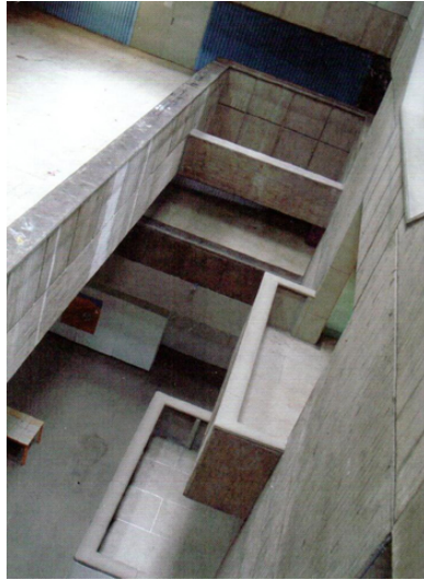
8. Interior de la Facultad de Arquitectura.

Sucedo algo similar con la conexión dos, en el Cerro Nutibara una pieza concreta inflexiona estratégicamente un punto de ciudad y detona nuevos usos y dinámicas resaltando un aspecto controversial en el contexto urbano contemporáneo: el paisaje; pero no como una problemática desde la crisis ambiental por la contaminación si no desde la apreciación estética y el deleite del mismo paisaje. Con la capacidad de brindar al espacio de luz natural y de la vista a la naturaleza y a la ciudad el edificio se convierte en un elemento más del paisaje sin importar la polémica de la condición constructiva, recordando que desde el Brutalismo no se pretende darle solución al estigma del espacio público, pero se logra en casos particulares con un adecuada conciencia de la Arquitectura del lugar.