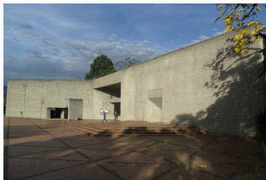
7. Capilla del Cementerio Jardines de Montesacro, vista del acceso frontal.