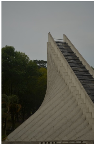
6. Capilla del cementerio campos de paz, vista frontal.

concreto a la vista en las vigas y la transparencia generada por el vidrio de los lucernarios – cerramientos es el paso de la luz el medio y el objeto que realzan esta obra.