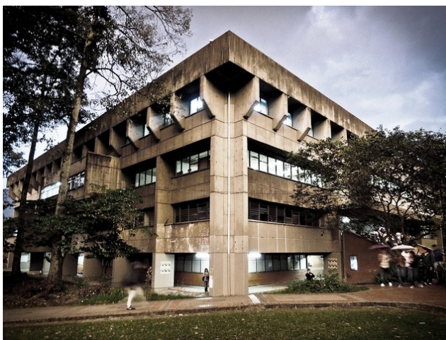
3. Facultad de Arquitectura de la Universidad Nacional de Colombia, Sede Medellín.

Los factores climáticos fueron condiciones importantes en el planteamiento del edificio, presentando ventanas remetidas y una serie de parteluces que el mismo concreto como medio plástico permitió, la sensación térmica interior es bastante agradable debido al excelente sistema de ventilación cruzada y la comunicación sucesiva de los espacios a diferente altura. El gran espacio central, iluminado de forma cenital a manera de patio irradia de luz los muros de concreto vaciados, las grandes luces facilitadas por la tecnología constructiva generan variedad y diferentes disposiciones en cada planta. Las plataformas que se proyectan al exterior como salientes se ligan en el interior como vacíos, es un conjunto de circunstancias sorpresa alrededor de un gran foro central enmarcado por los recorridos y la escalera. Esta condición íntima del espacio conformado por diversas estancias, recorridos y jerarquías comunes sorprende al visitante predispuesto ante la agresividad aparente de las fachadas. La espontaneidad planeada genera una y otra vez estrechez y ampliación de ciertos corredores comunicados a doble y hasta triple altura.