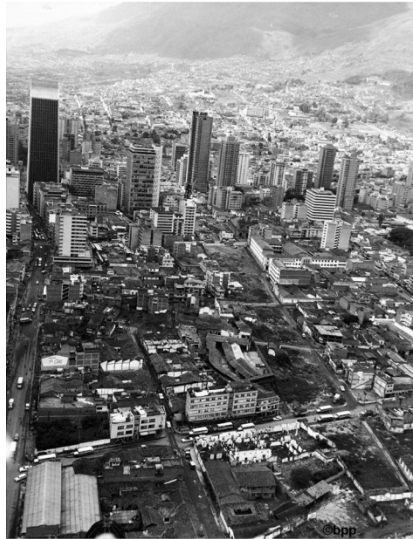
1. La ciudad de Medellín el año 1973, vista al centro.