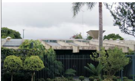
03 Casa Mario Petrelli (1964)