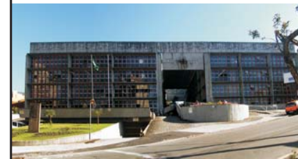
05 IPE (1967)