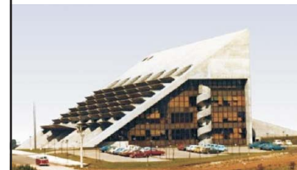
06 ACARPA EMATER (1977)