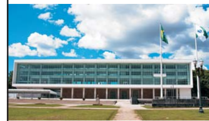
07 Centro Cívico (1951)