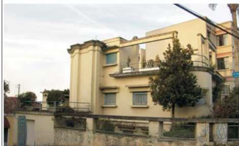
04 Casa Frederico kirchgässner (1930)

Inscrições: R$ 50,00 Secretaria XDocomomo 19.OUT.2013 Sabado