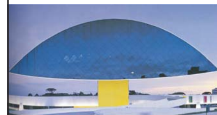
08 Museu Oscar Niemeyer (1971)