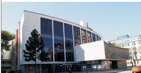
02 Teatro Guaíra (1948)