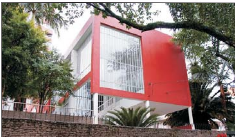
01 Instituto Vilanova Artigas (1953)